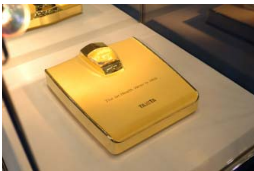
家庭用ヘルスマーター1号機純金製レプリカモデル