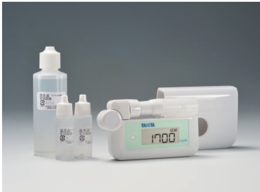
携帯型デジタル尿糖計「UG - 201」初回セット