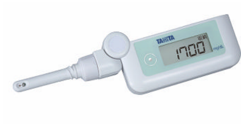
ポケットにも入る携帯型デジタル尿糖計「UG - 201」