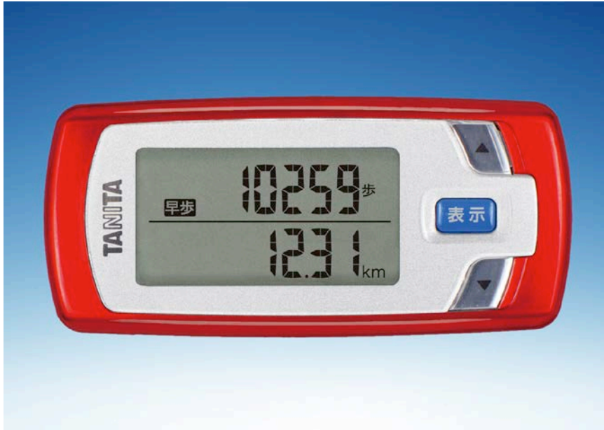
「歩き」と「早歩き」を自動で判別する「EZ-062」