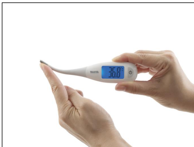
先端部が柔らかく、わきに優しくフィットするフレキシブル測定部